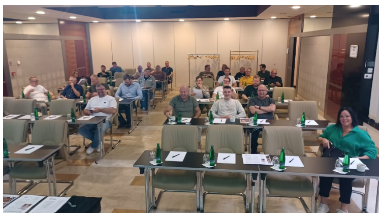
Bild: Deltagarna anländer en efter en. När är alla samlats drar vi igång!

Första delen av dagen tog plats i konferensrummet. Det var nämligen dags för det årliga höstmötet.