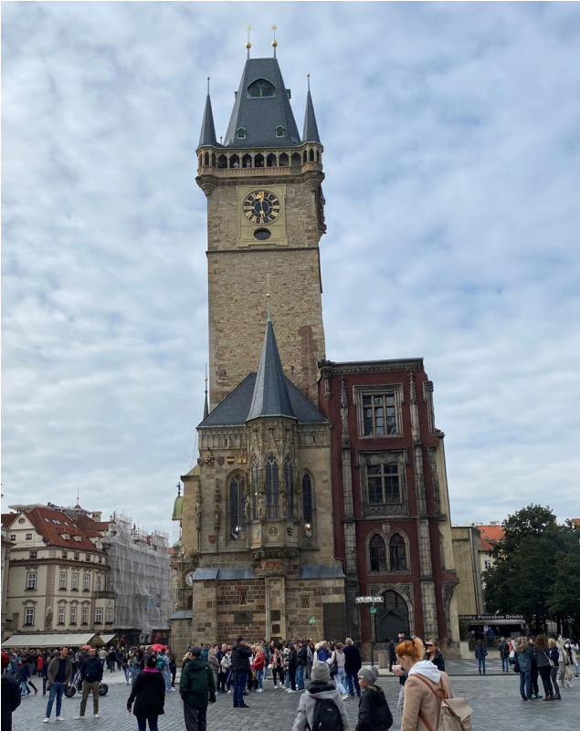
Bilder: Guidad vandring i Prag med lunch