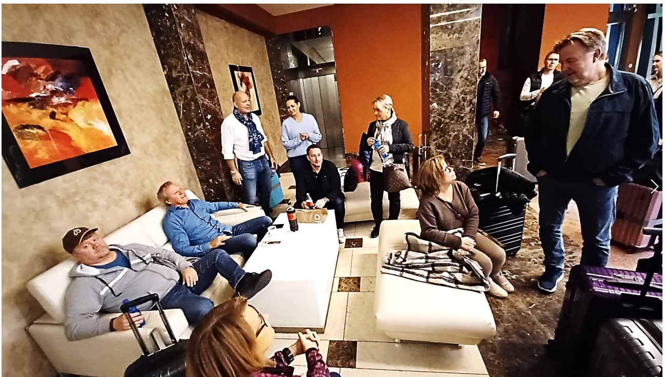
Bilder: Lobbyn, avresedagen