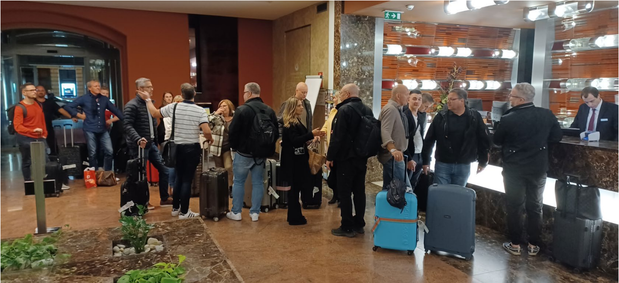
Bild: Resenärerna från Stockholm checkar in på hotellet