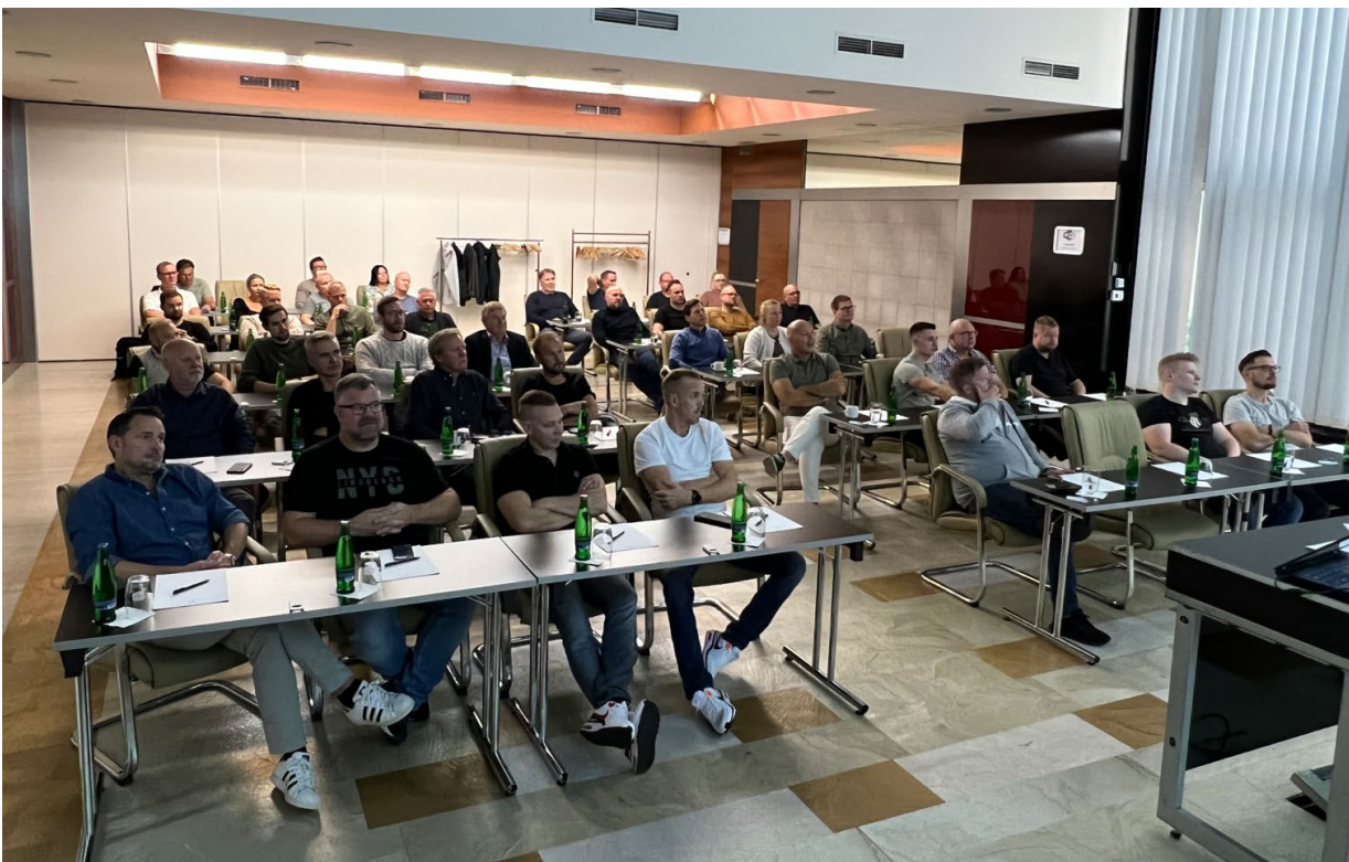
Bilder: Ecophons konferens