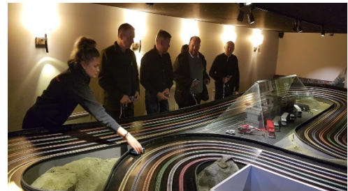
Figur 8: Grand Prix